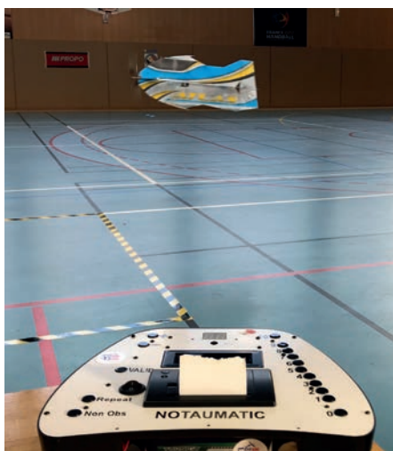
Le système Notaumatic a une fois encore démontré son efficacité.