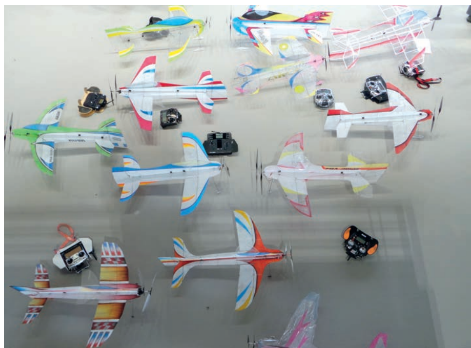
Une petite partie du parc à modèles: précision et légèreté ne sont pas de vains mots!