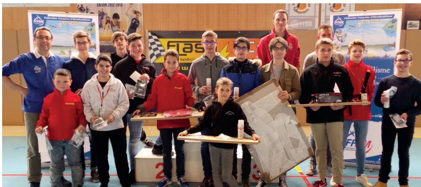
Les nombreux sponsors ont permis de récompenser la jeunesse, qui est l'avenir de notre hobby.