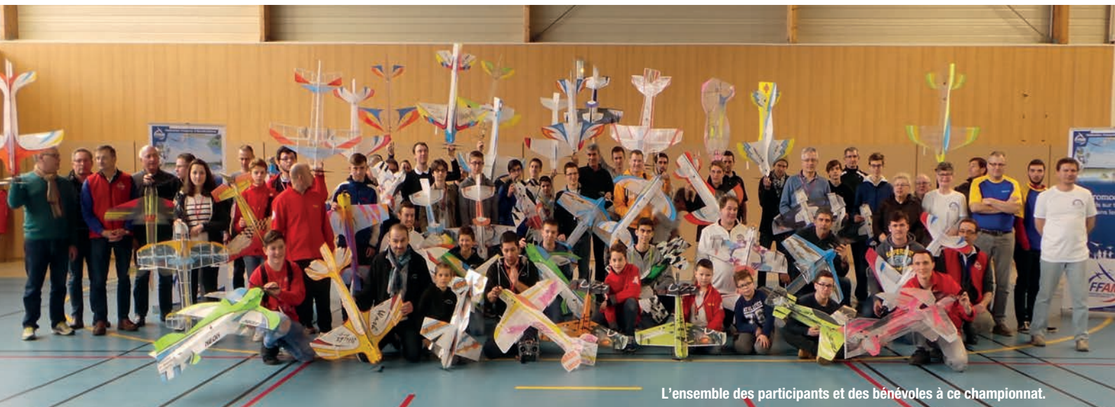
L'ensemble des participants et des bénévoles à ce championnat.