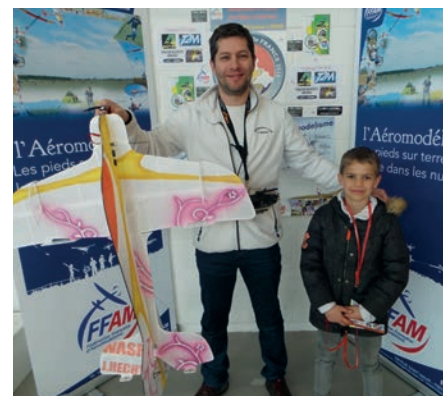
Le «Coin photo»: chaque pilote était photographié avec son coach et son modèle.