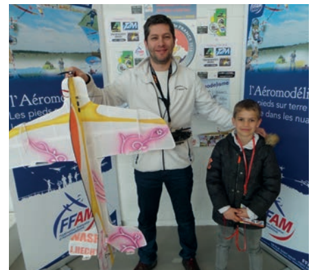
Le «Coin photo»: chaque pilote était photographié avec son coach et son modèle.