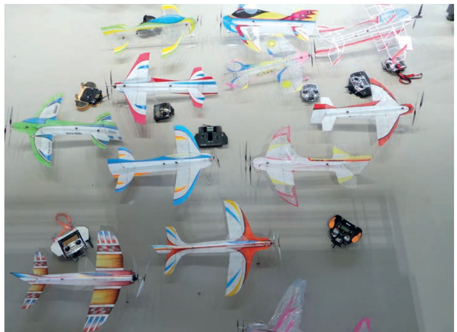
Une petite partie du parc à modèles: précision et légèreté ne sont pas de vains mots!